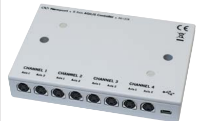
AG-UC8小型8軸コントローラ