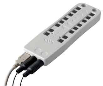
AG-UC2ハンドヘルド2軸コントローラ

1 USB-CH1は、AG-UC2の使用時、電源をPCから供給できない場合のみ必要となります。