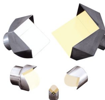
既存レトロリフレクター製品群

https://www.newport.com/f/low-profile-retroreflectors