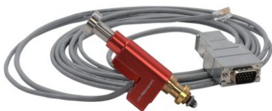
8311 クローズドループピコモーター