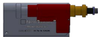
8310CE との比較(灰色が 8310CE)