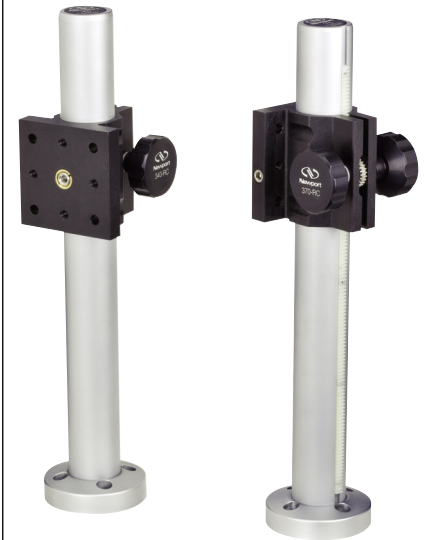
ロッドとクランプ (P996参照)

ミラーマウント レンズホルダ 専用光学マウント ルーラシステム メカニカルシャッタ アクセサリ ニューズプラットフォーム ポスト&ロッドシステム コンポーネント ツールキット