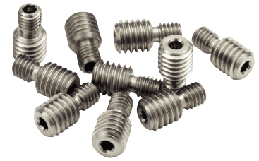
TAシリーズメス-オスネジアダプタ