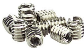
TRシリーズ オス・メスネジアダプタ