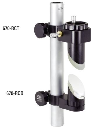
モデル70ロッドにマウントし、Newportの精密オプティクスを実装した状態