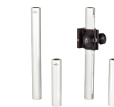
標準およびheavy duty ロッド (P994参照)