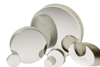
広帯域金属ミラー (P684参照)