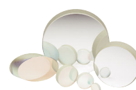
広帯域誘電体ミラー (P682参照)

ミラーマウント レンズホルダ 専用光学マウント ルーラシステム メカニカルシャッタ アクセサリ ネース&フランク ポスト&ロッドシステム コンポーネント マウント