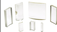
BK 7精密シリン ドリカルレン ズ (P783参照)