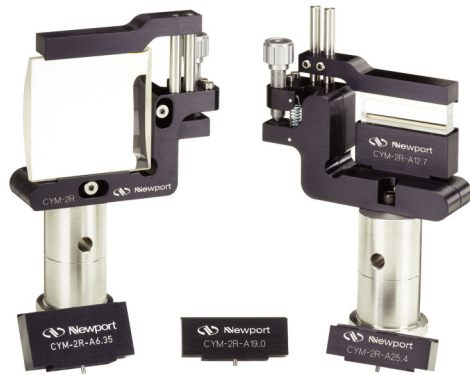
(アダプタ、ポスト、レンズは別売です)