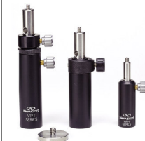
ポストマウント オプション (P976参照)