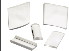
UVフューズド シリカ精密シリン ドリカルレン ズ (P785参照)

ミラーマウント レンズホルダ 専用光学マウント ルーラシステム メカニカルシャッタ フセサリ ネース&フライング ボスト& ロッドシステム コンポーネン ツマウント