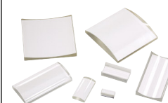
VALUMAX® BK 7 シリンドリカル レンズ