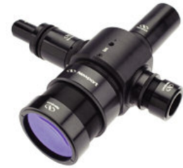
CH-1ビームスプリッタマウントが実装されたレンズチューブアセンブリ

LTシリーズのレンズチューブは、複数のレンズを単独のホルダにマウントする手段を提供します。各レンズチューブの一方の端にはメスネジが、もう一方の端には同じタイプのオスネジが付いています。これにより、端と端を相互に接続できるため、構成に制限はありません。各レンズは、ネジ付きのリテーニングリングにより所定の位置に保持されます。また、各レンズチューブにはリングが1つ備わっています。