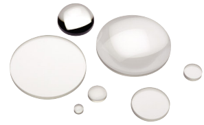
BK7精密平凸レンズ (P711参照)

NewportのACシリーズのアジャスト式レンズマウントは、多様性、使いやすさ、および性能を高めるためにデザインが変更されています。このマウントは、円形部品であれば厚さや長さを問わずに正しい向きでしっかりと固定できます。ノブネジで固定された3つのデルリン製支持アームは動きが滑らかで、位置を容易に調整できます。ALMシリーズは、オプティクスをビームに合わせて精密にセンターリングでき、オプティクスの着脱の際に高い再現性が得られます。デルリン製V字チップ付きシャフト3本（1本バネ式）でレンズを保持します。