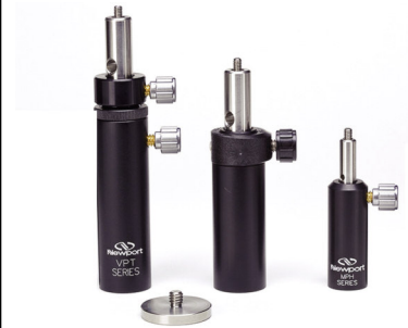
ポストマウントオプション (P976参照)