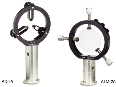
ペDESTルポストは別売です