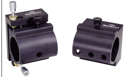
ULM-TILTは、あらゆるレーザービームに対してLC-075の位置決めや取付けに最適です。(P153参照)