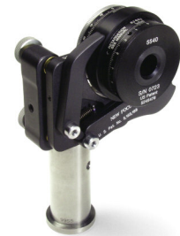
Model 5540バリアブルウェーブプレートをペDESTALライザに取り付けた Model 9854 Opti-Claw™ マウントにマウントした様子。