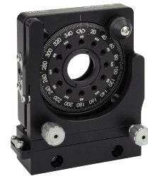
GM-1RA波長板/偏光子回転マウント (P913参照)