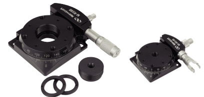
RSシリーズ回転ステージ (P417参照)