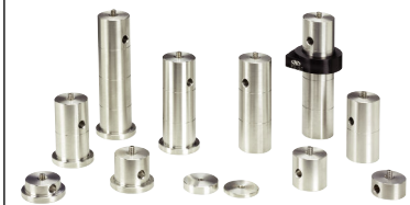
PSシリーズ ベディスタルポストシステム (P986参照)