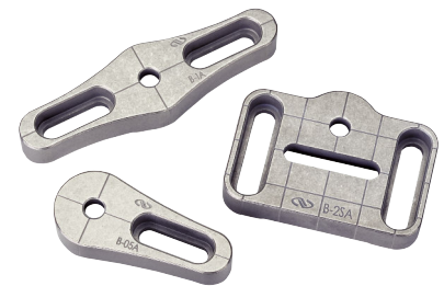
スロット付きベース (P961参照)