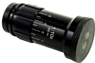
ビームエキスパンダ (P810参照)