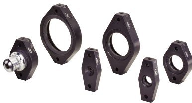
LHシリーズ レンズマウント (P893参照)