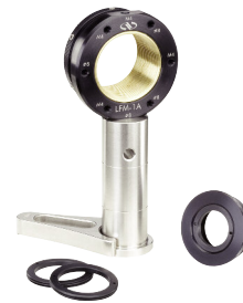
LFMシリーズ レンズフォーカシングマウント