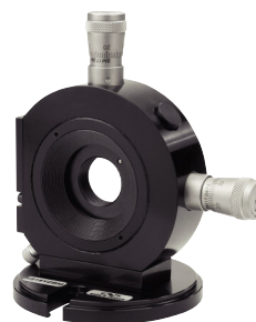
高精度光学ポジショナ (P903参照)