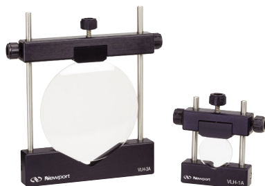
VLH-3A可変レンズホルダ (P895参照)