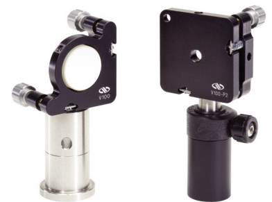
Vizix™ シリーズキネマティック光学マウント (P872参照)