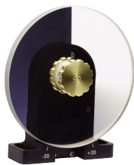
円形可変NDフィルタ用オプションを付けたNew StepTMNSR 電動回転ステージ (P532参照)