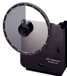
946円形可変NDフィルタ/ビームスプリッタ マウント