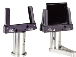
バネ式フィルタホルダ P1005参照