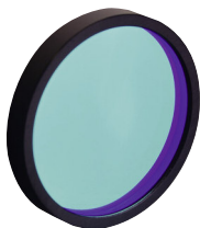
ダイクロイックレーザービームコンバイナ P650参照