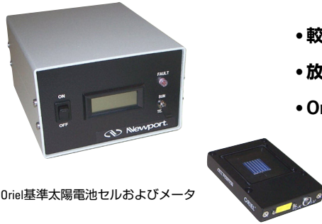
Oriel基準太陽電池セルおよびメータ