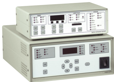
68951デジタル照射コントローラおよび69920 1000 Wソーラーシミュレーター電源

「68951デジタル照射コントローラ」は、光強度コントローラとデジタルタイマが一体化されています。これは、一定の光レベルを維持し、時間調整または照射量ベースの照射制御が可能です。光強度コントローラまたは照射量制御を必要としないお客様には、弊社ではスタンドアロン型のデジタルタイマ、モデル68945をお勧めします。両機器ともRS-232インタフェースによりPCを介して制御できます。