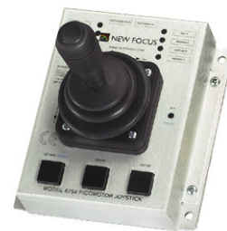
Model 8754 iPicoジョイスティック