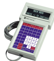
Model 8757 iPicoハンドパッド