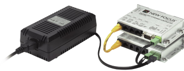
Model 8763-KIT3 軸iPico™ドライバキット

Picomotorアクチュエータの駆動・操作には、別売りのドライバキットが便利です。モデル8763-KIT3 軸iPico™ドライバキットは、ネットワークコントローラとドライバから成るキットで、最高3個のPicomotorアクチュエータを個々に操作できます（モデル8753 iPicoドライバモジュールを最高30台まで追加して稼働軸数を増やせます）。