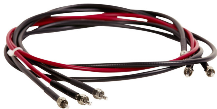
耐ソラリゼーションファイバ

未処理のファイバを260 nmより短波長のUV光に長期間さらすと、光の作用によりUV透過率がかなり低下します。弊社の耐ソラリゼーションファイバは、DUV光の影響による損傷を防ぐようになっています。その寿命は3つの条件で決まります。