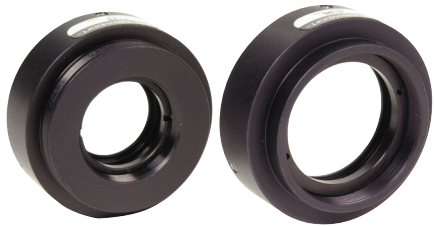
フランジマウントセル

このシンプルなマウントは、一端に1.5インチシリーズメス型フランジ、他端にオス型フランジを備えています。弊社の光源、モノクロメータおよびその他のフランジ付機器の入射口および射出口に光学アクセサリを接続するのに最適です。