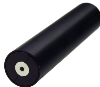
SCG-800スーパーコンティニューム発生モジュール