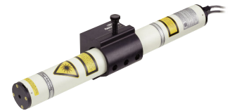
レーザーを取付けたULMマウント