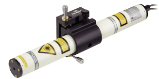
レーザーを取付けたULM-TILTマウント