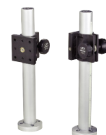
ロッド、ロッドクランプ (P994を参照)