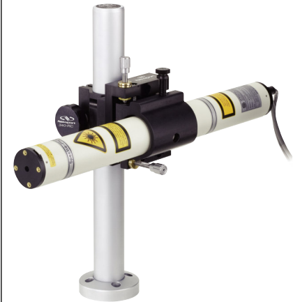
ロッドとロッドクランプを使用した円筒形レーザーマウントアッセンブリ