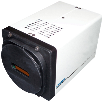
Oriel ISX CCD Camera 78234

Oriel ISX CCD (モデル 78234) カメラは、デジタル信号処理 (DSP) により科学計測用に設計された熱電冷却、高性能、後方照明機能をもつ CCD センサです。本製品には、多彩なスペクトログラムの作成を可能にする Oriel 装置用 InstaSpec Pro ソフトウェアが付属しています。浮動小数点 DSP やプログラマブル ゲート アレイにより、ビニング パターンや後処理アルゴリズムなどを組み込むことができます。Oriel ISX CCD には、標準の高速インターフェースである USB2.0 が装備されているため、カスタム インタフェース カードは不要です。Oriel 装置用 InstaSpec Pro ソフトウェアを使用して、2台のカメラ操作やユニークな "Stitch&Glue" 機能による出力合成などカメラやスペクトログラムを直接制御することも可能です。