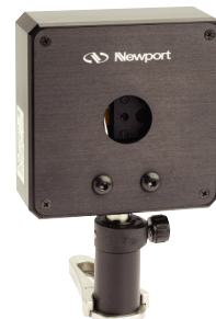
最適で最もお求めやすい価格の温度制御用レーザーダイオードについては、P146を参照してください。