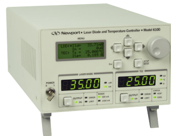
最新のコンポ型レーザーダイオードと温度コントローラについては、P141を参照してください。