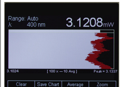
垂直ストリップチャートディスプレイ