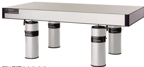
テーブルと脚は別売となります