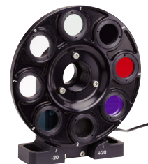
電動フィルタホイール (P532参照)