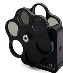
モデル5214および5215フィルタホイールにはNDフィルタ一式が付属しています。