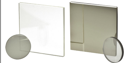
UVフューズドシリカ金属NDフィルタ (P664参照)